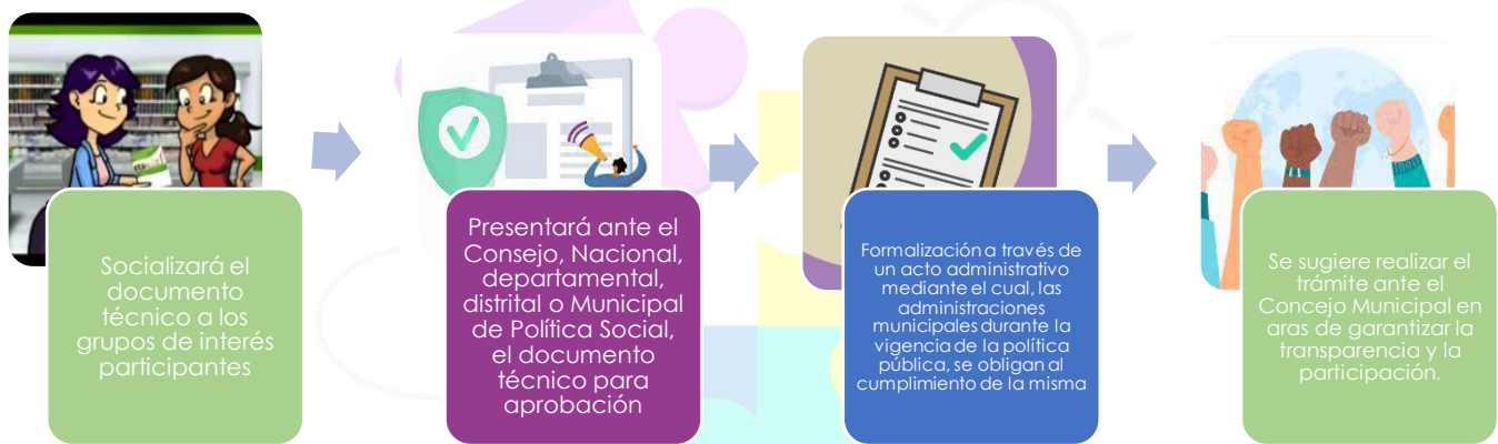
Ilustración 2 Formalización Política Pública