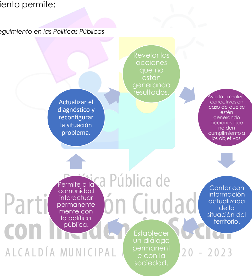
Ilustración 3 Seguimiento en las Políticas Públicas

5. Fuente 3. Elaboración propia- Información tomada de la Guía Metodológica para las políticas públicas municipales- Chía